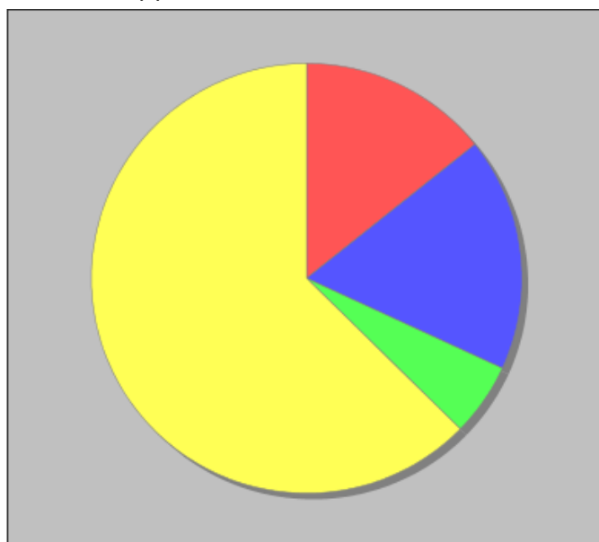
Distribuzione dei docenti a T.I. per anzianità nel ruolo di appartenenza (riferita all'ultimo ruolo)